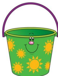
gol / goală