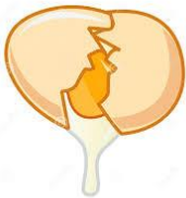
spart / spartă