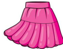
larg / largă