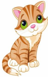
blând / blândă