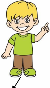
mic / mică

Alege cuvântul corect pentru fiecare imagine ca în model.