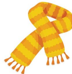
gros / groasă