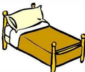
confortabil / confortabilă