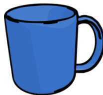
colorat / colorată