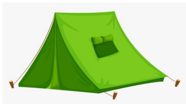
încăpător / încăpătoare