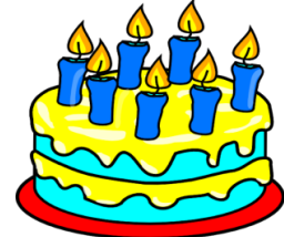
delicios / delicioasă