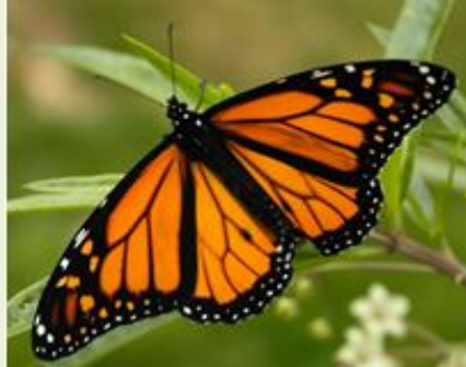
Câteva dintre fluturi ex. fluturele Monarch