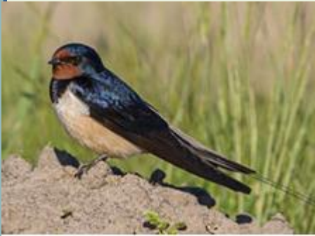
Păsări precum rândunica